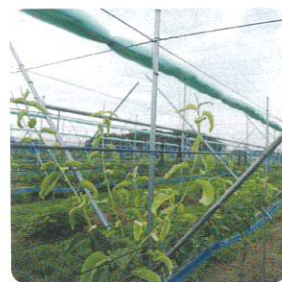
▲V字ジョイント栽培

また、「V 字ジョイント栽培」という栽培方法を採用しています。苗木と苗木を接ぎ木の技術で接続し、名前のおり V 字状に枝を伸ばし栽培することで、腕を持ち上げたり、かがんだりする作業が減るメリットがあります。